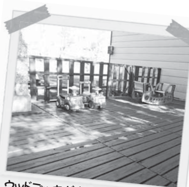
ウッドデッキが完成しました！ 暖かい日は、お外でリフレッシュ☆

段々と暖かくなり、支援センターに徒歩で遊びに来る親子の姿が見られるようになって来ました。