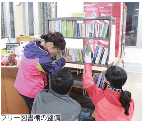
フリー図書棚の整備