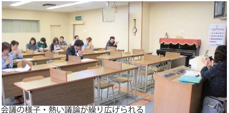
会議の様子・熱い議論が繰り広げられる

が開催する行事のひとつ。読書まつりの前後は、読書推進月間と設定し、公民館内を使った本の特別展示など、本に触れる機会をたくさん提供しています。