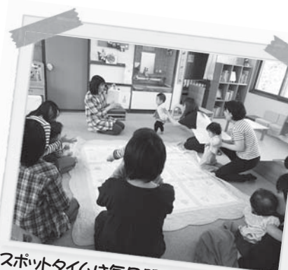
スポットタイムは毎日開催。 親子で手あそびや絵本を楽しんでいます