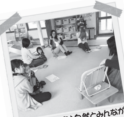
わらべうた講座♪自然とみんなが 笑顔になる素敵なひと時でした