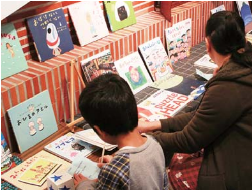
読書推進月間の展示

夏は、公民館図書室ミニイベントを開催。本を借りるとスライム作りなどが体験できる、子どもに人気のイベントです。11月の「読書まつり」も、推進委員会