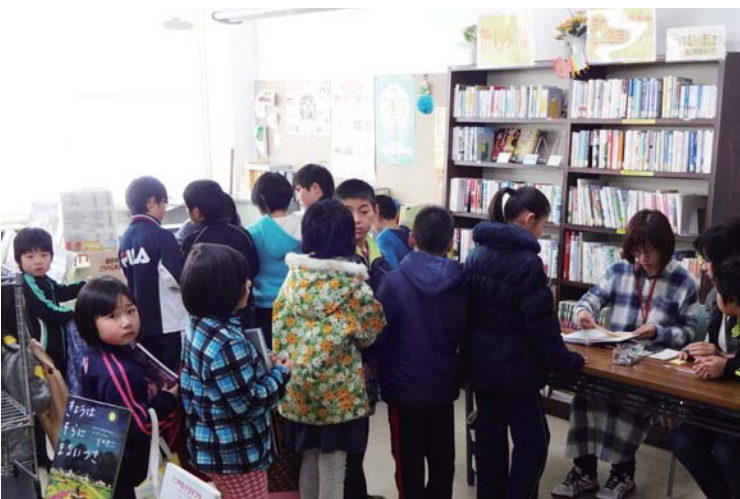
公民館図書室で本を借りると参加できるイベントが多いので、イベント時は貸出の行列ができる