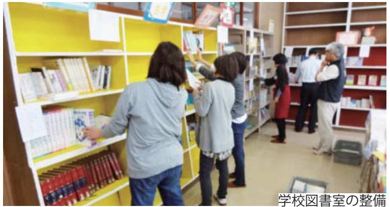
学校図書室の整備