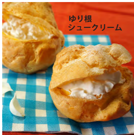
ゆり根 シュークリーム