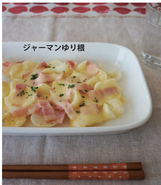
ジャーマンゆり根