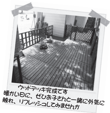
ウッドデッキ完成です 暖かい日に、ぜひお子さんと一緒に外気に 触れ、リフレッシュしてみませんか

段々と暖かくなってきました。時折、寒い日もありましたが、歩いて遊びに来る親子の姿も見られ、楽しんで過ごしてくれました。