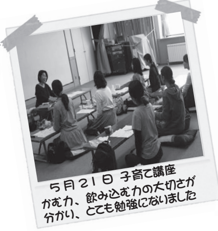
5月21日 子育て講座 かた力、飲み込め力の大切さが 分かり、とても勉強になりました