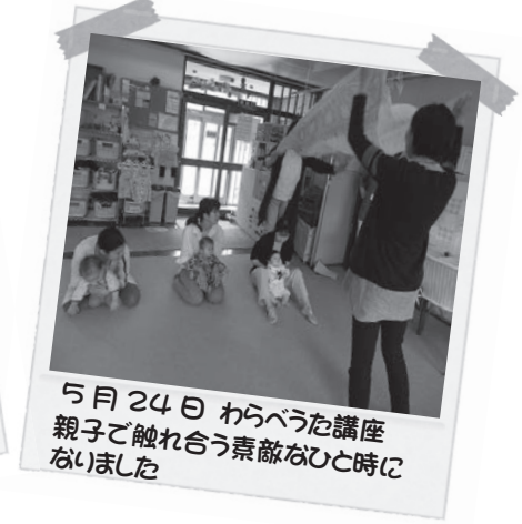
5月24日 わらべうた講座 親子で触れ合う素敵なひと時に なりました