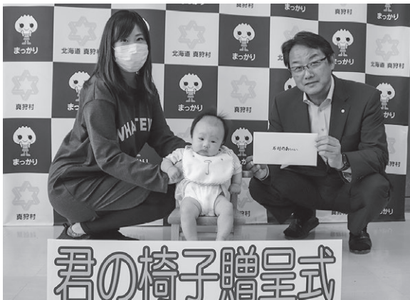
3月21日生まれ 石村のあちゃん

「生まれてくれてありがとう 君の居場所はこちらにあるからね」という想いを伝えるため、令和4年度から真狩村の新生児に「君の椅子」を贈る事業を行っています。