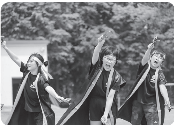
5・6年生は力強く「よさこい！」