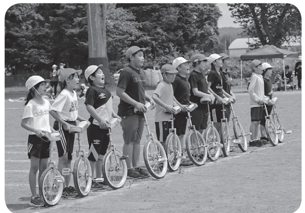
御保内小に在籍していた児童が一輪車を披露