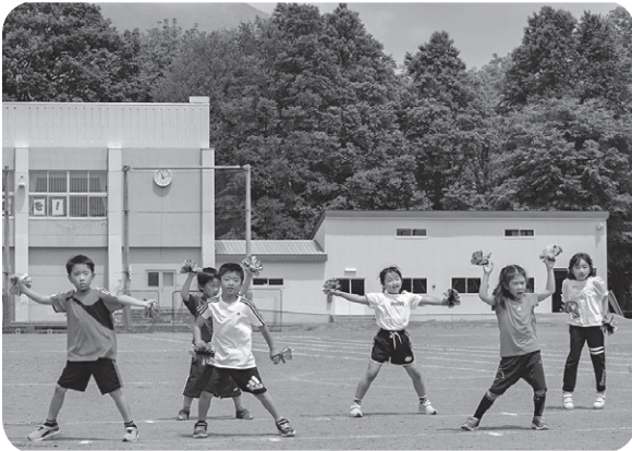
1・2年生の可愛いダンス