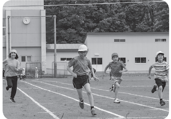
学年ごとの徒競走