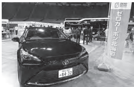
トヨタ「MIRAI」1回の水素充填で約800km 走行可能

企業などが出店し、環境に関するワークショップなどを実施。ゼロカーボン北海道のブースでは、FCV（燃料電池自動車）を展示しました。この車は走行中にCO 2 を排出せず、排出するのは水のみ。水素充填時間は1回3分程度でガソリンを入れる感覚と一緒に、騒音が少ないといった特徴があります。