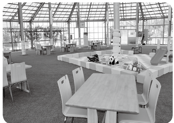
休憩スペースとしてご利用ください