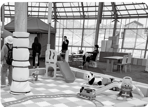
ゴールデンウィークにはイベントも開催