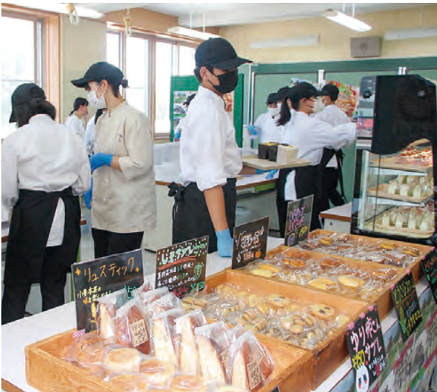
真狩高校 La mikka も盛況