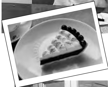
最優秀賞を受賞した「ごろっとまるっとアロニアタルト