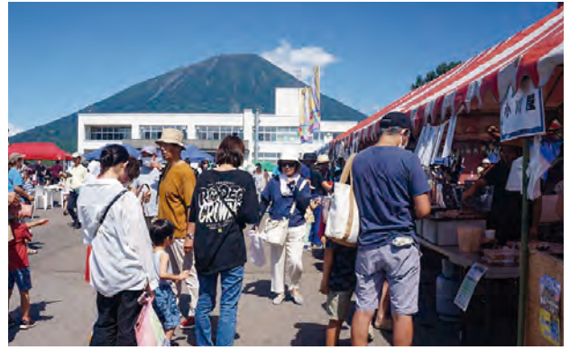
出店には長い行列が