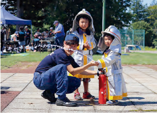
ちびっこが消火器体験