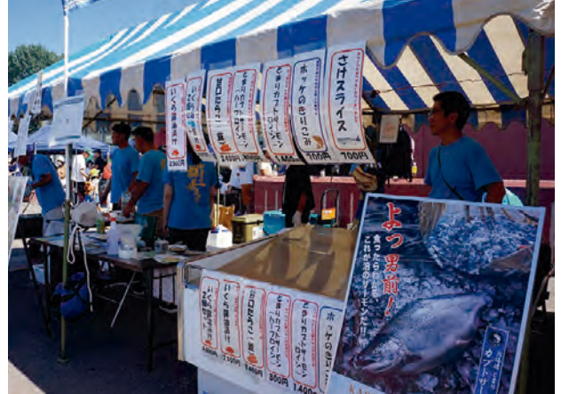
泊村の名産品がずらり