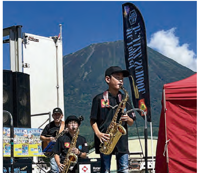
Mt.youtei Jr.JAZZ SCHOOL の演奏でスタート