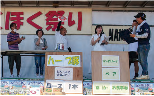
ほくほくオークション