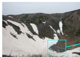
この時期限定！ 父釜の中の残雪と沼 (6/5撮影)