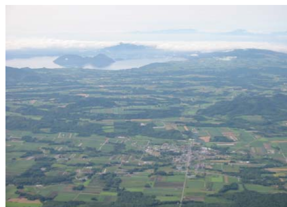
真狩ピークからの真狩市街と洞爺湖