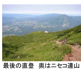
最後の直登 奥はニセコ連山