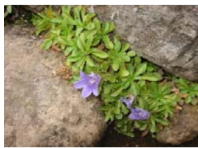
8合目付近のイワギキョウ (9/3撮影)