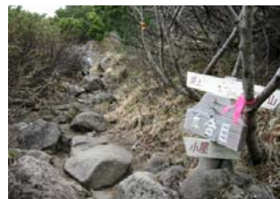
九合目 頂上は正面へ、避難小屋は左へ