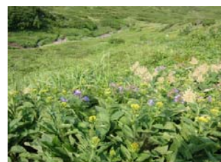
7月下旬 九合目付近の花々