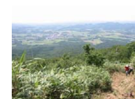
眼下に真狩市街や洞爺湖