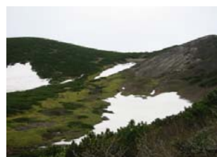
九合目～外輪山の残雪 (6/5撮影)

ハイマツのトンネルをすぎ、真狩肩を越えるといよいよ最後の直登となり、浮石に足を取られぬよう注意。 6月中旬頃までは残雪あり(右写真)。また7月下旬頃からこのあたりにはお花畑が広がります。