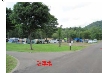
キャンプ場 (8月中旬撮影)

問合せ・申し込み先 森林学習展示館 Tel.0136-45-2955 休館日 月曜日(月曜が祝日の場合は火曜) ※7月下旬～8月下旬は無休