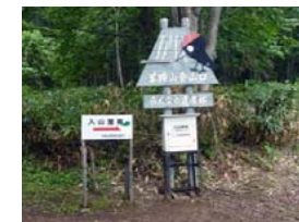
登山口と登山者名簿記帳所