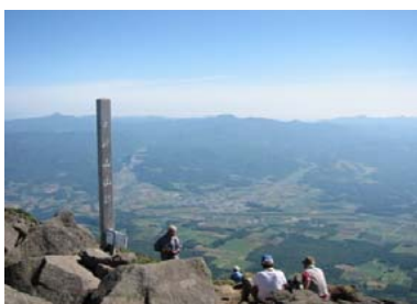
山頂 (真狩ピークから約30分)