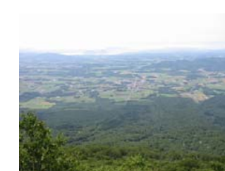
六合目からの展望