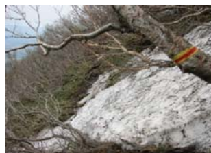
登山道にはまだ残雪が (6/5撮影)