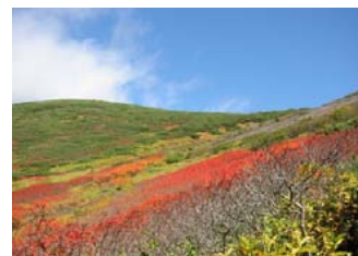
9月中旬 九合目付近の紅葉

・服装 登山中は涼しい服装でもよいですが、山頂付近は強風の場合もあるため夏でも必ずウインドブレーカなどの防寒具を持参すべきです。靴はスニーカーでは滑るのでトレッキングシューズや登山靴は必需。また、水分は十分に用意してください。九合目と避難小屋の間に、7月上旬頃までの時期限定ですが水場があります。