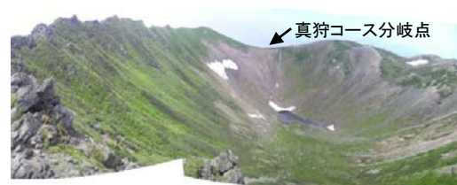
真狩コース分岐点

山頂からみた父釜 (6/29撮影) ※外輪山には4つのコースからの分岐点がありますが、濃霧時は帰りの下山方向標識の見落としで迷うことのないよう特に注意してください。