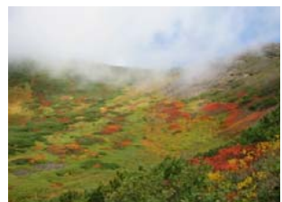
左と同所の紅葉 (9/15撮影)