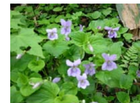
タニマスマシレ (6/5撮影)

・二合目～三合目 尾根を越え東側へこのあたりから時期により花々がみられます。二合目半には広い休憩場所あり。