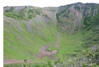
夏の父釜のようす (7/28撮影)