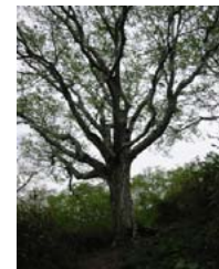
みごとなダケカンバ

・四合目～五合目 ダケカンバの大木が点在する。 ・五合目～六合目 まるで展望台のような六合目。