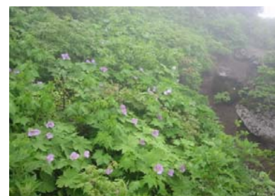
寄り道... 九合目から避難小屋方向に5分ほどでシラネアオイの群生地 (7/9撮影)