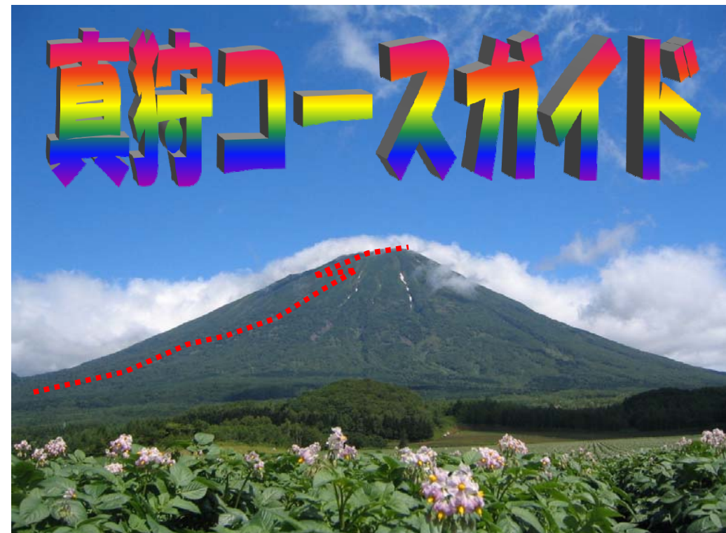
ジャガイモの花と羊蹄山